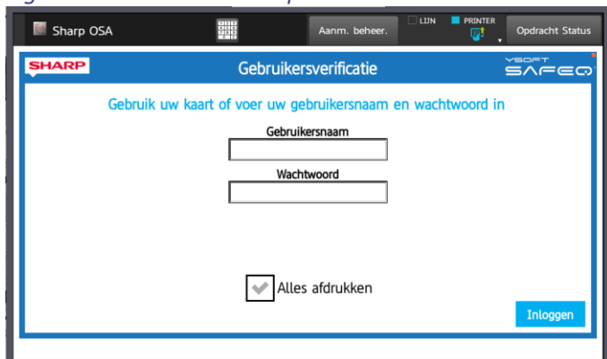
Figuur 2 - Aanmelden met chip (pas/druppel)